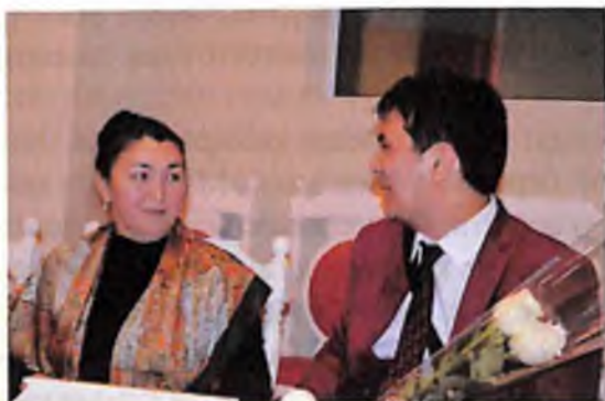
Шығарма авторы: Р.Мұқанова мен қоюшы режиссер: Б.Нұрғалиев

Өткір шығармалар ешқашан өзектілігін жоғалтпайтыны айдан анық. Басқа режиссерлер осы іспетті пьесаларды сахнада шынайы түрде көрсетсе екен деген игі тілектеміз. Ал, біз Балтабекке әрдайым шығармашылық шабыт тілей отырып, жаңа басқан қадамы құтты болсын демекпіз!